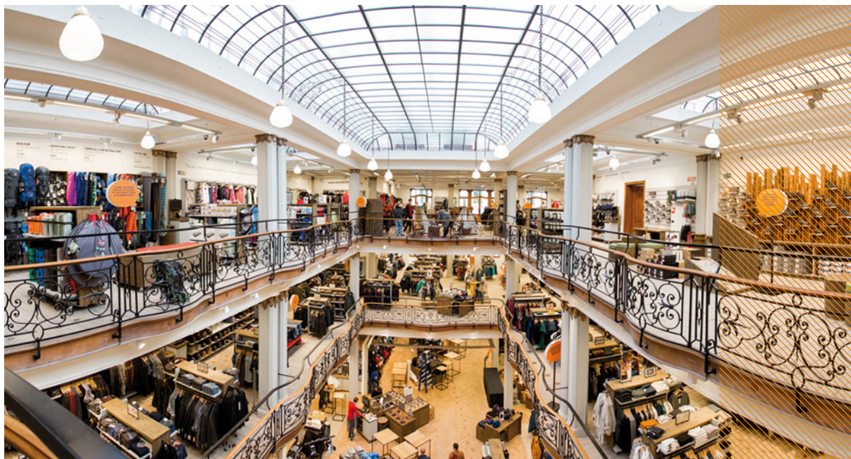
Gand - Zonnestraat 6-8 - AS Adventure

VASTNED RETAIL BELGIUM SA, société immobilière réglementée publique de droit belge Taco de Groot, Rudi Taelmans ou Reinier Walta, tél. + 32 3 361 05 90, www.vastned.be