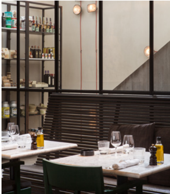
au-dessus: boutique - en-dessous: restaurant