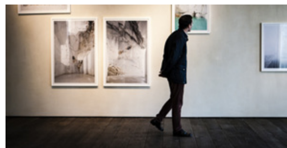
au milieu: appartement luxueux - en bas à droite: 'the gallery'

Sur Vastned Retail Belgium. Vastned Retail Belgium est une société immobilière réglementée publique de droit belge (SIR) dont les actions sont cotées sur Euronext Brussels (VASTB). Vastned Retail Belgium investit exclusivement dans l'immobilier commercial belge, en mettant l'accent sur des magasins de premier ordre dans les grandes villes (des immeubles de premier ordre situés dans les meilleures rues commerçantes des grandes villes Anvers, Bruxelles, Gand et Bruges). En outre la société possède des magasins de premier ordre (des magasins dans le centre des villes en dehors des grandes villes) et d'autres biens immobiliers (des parcs de vente au détail et des magasins le long d'axes routiers hautement qualitatifs). La SIR souhaite investir à terme 75% dans des magasins dans le centre des villes.